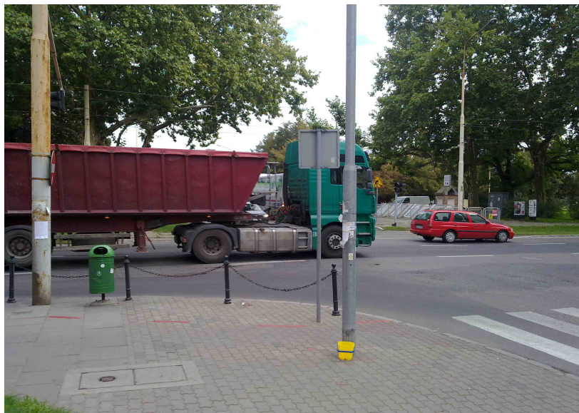
SS30 Słupek b - mocowanie boczne na istniejącej konstrukcji, , ,

Treść tabliczek i kolejność (wyżej/niżej) zawieszenia: