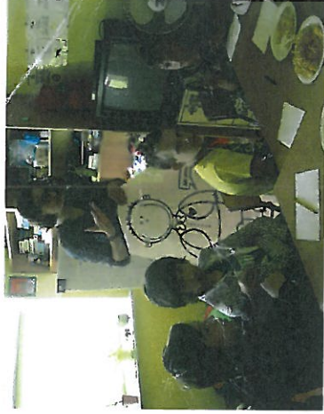
Organizujemy szkolenia dla naszych wolontariuszy