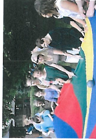
Odwiedzamy pensjonariuszy Domów Pomocy Społecznej - DPS Nowogard.