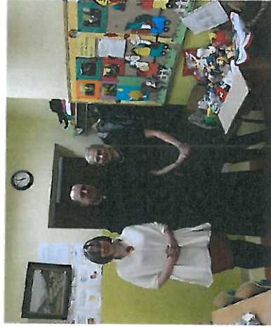
Wspieramy lokalne działania wolontaryjne - Akcja "Szlachetna Paczka"