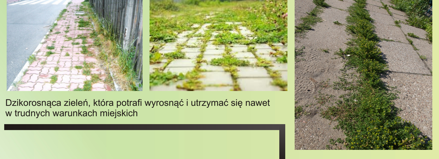
Dzikorosnąca zielen, która potrafi wyrosnąć i utrzymać się nawet w trudnych warunkach miejskich