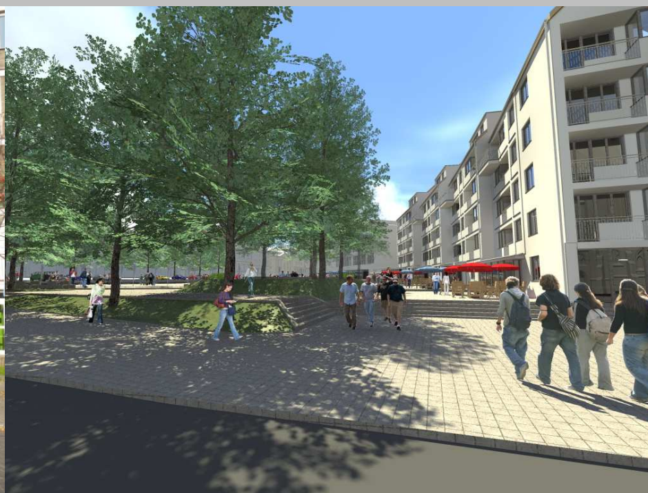
ul. Plac Orła Białego - po zmianie

Koncepcja zagospodarowania Placu Orła Białego – widok od ul. Grodzkiej