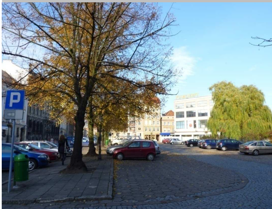
Plac Orła Białego – przed zmianą