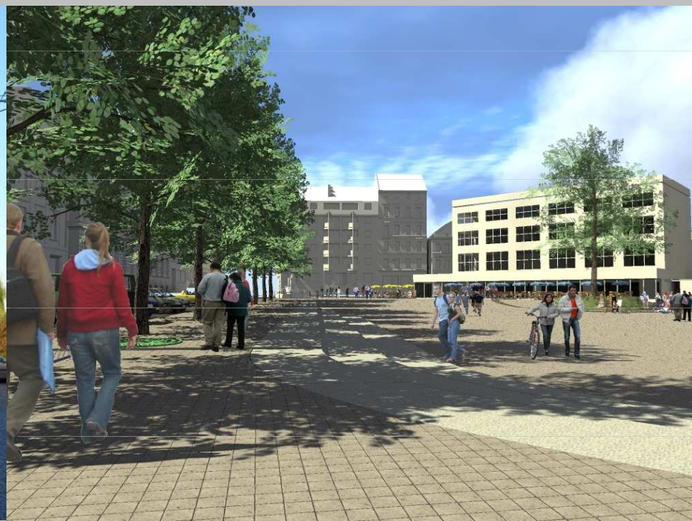
Plac Orła Białego - po zmianie

Koncepcja zagospodarowania Placu Orła Białego – widok od ul. Grodzkiej i Staromłyńskiej