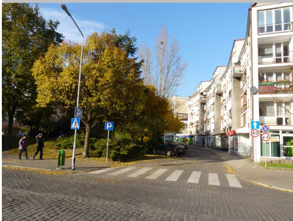
ul. Plac Orła Białego – przed zmianą