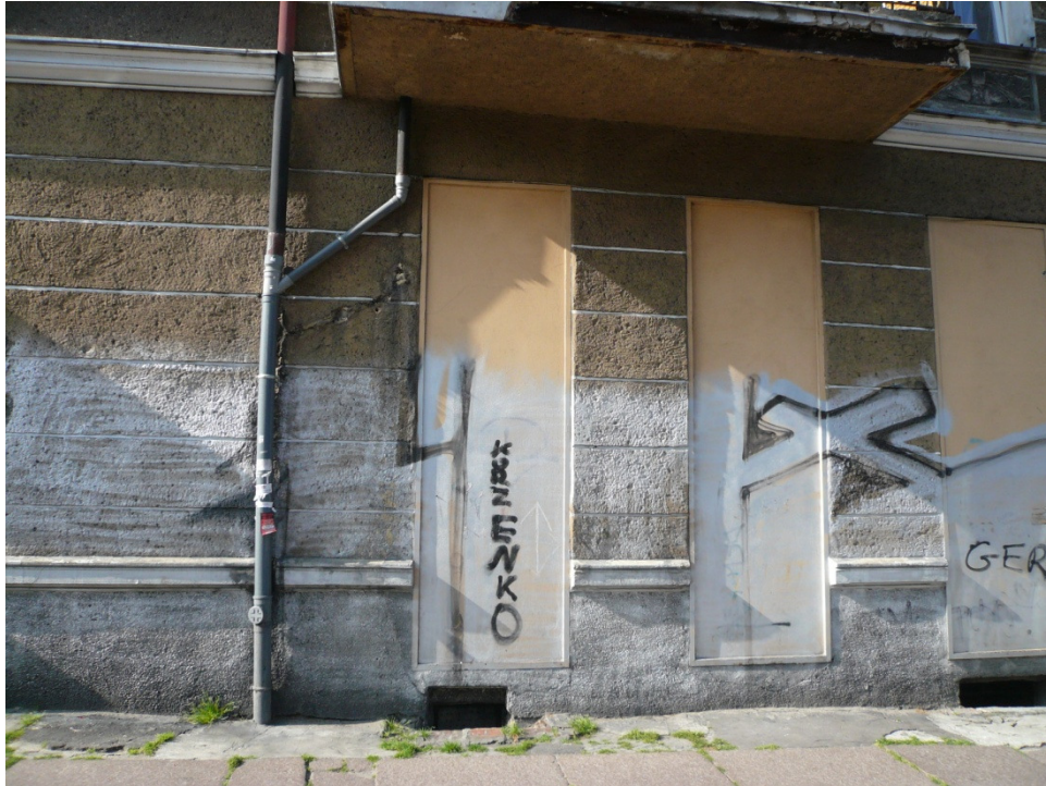
10.1 Zdjęć obudowy otworów okiennych zamontować nowe okna zgodnie z opisem PFU