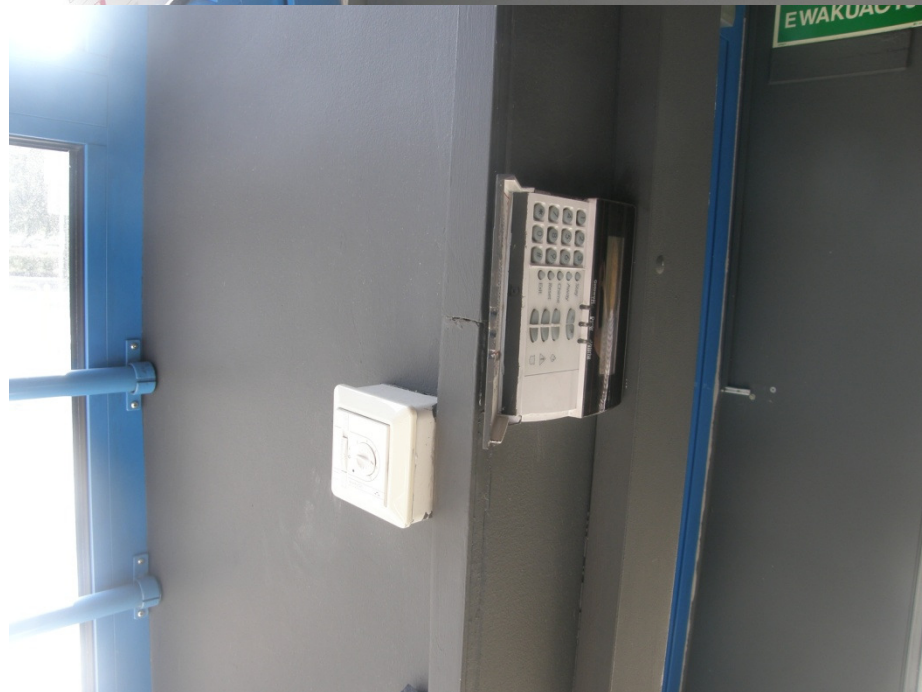
Elementy instalacji alarmowej oraz ogrzewania podłogowego