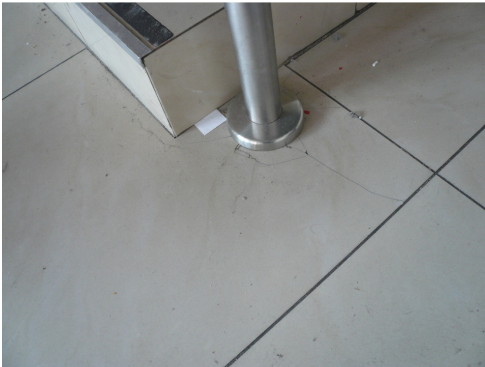
1.7 Wymienić popękane płytki, dobierając na ich miejsce odpowiednie wymiarem, kolorem i fakturą.