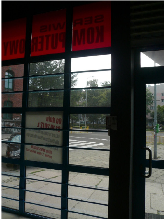
1.6 Ad. Pkt 4 pkt 4 - zabezpieczyć szyby wszystkich okien folią matową.