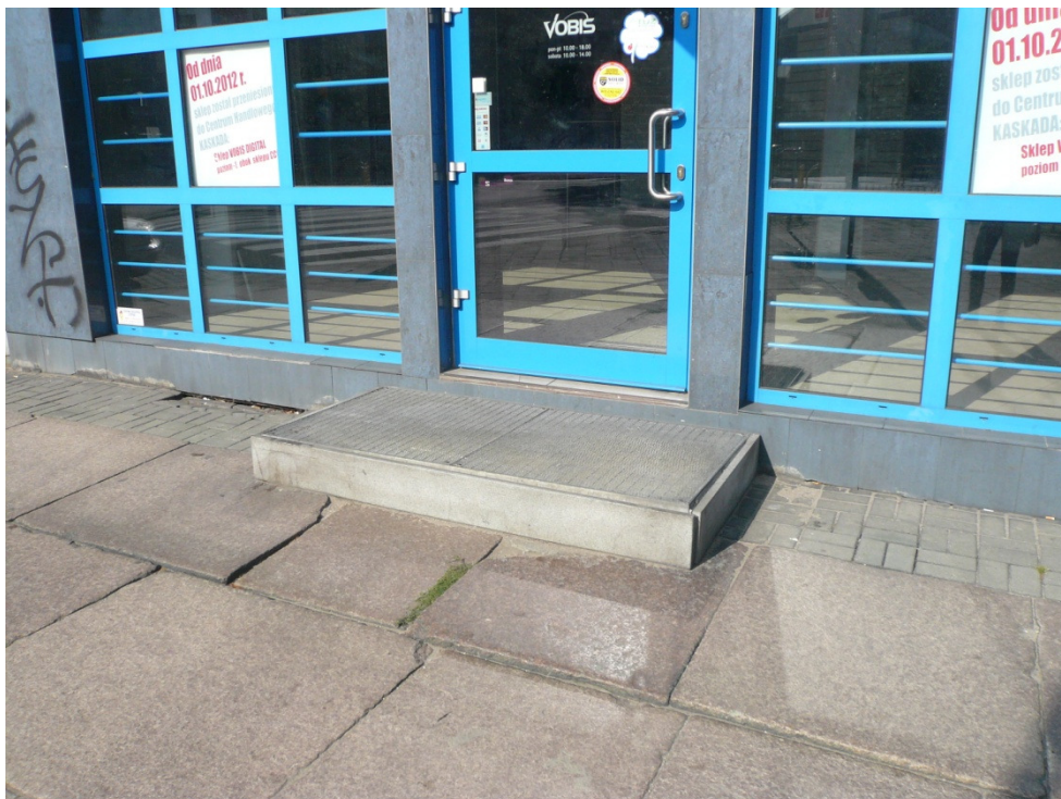
10.4 Ad. Pkt 2.2.2 ppkt 7 - zlikwidowanie barier wewnątrz pomieszczeń, w celu umożliwienia korzystania z pomieszczeń przez osoby niepełnosprawne.