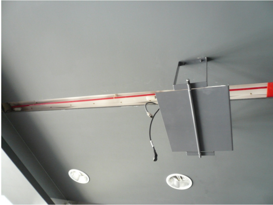
3.1 Uzupelnic brakujace maskownice swietlowek.